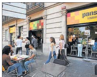
Un establecimiento de Pans &amp; Company

■ EatOut comunicó ayer que tiene más de 400 restaurantes con una facturación superior a 240 millones en el 2014. La empresa gestiona 11 marcas propias (Pans & Company, Ribs y Santamaria, otras como FresCo, Caffé di Fiore o Pollo Campero), y crece en aeropuertos y estaciones. EatOut, en proceso de reestructuración, forma parte del grupo Agrolimen, cuya estrategia se centra en Gallina Blanca y Affinity. / Redacción